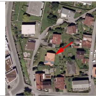
2015 - Luftbild