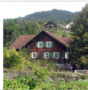
2014 - Am Bach 4