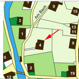
1910 - Plan Grafik: B. Oprießnig