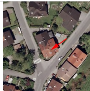
2015 Luftbild