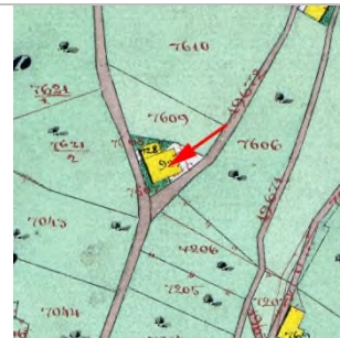
1857 Katasterplan