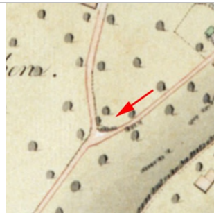
1827 Negrelliplan

Dornbirn Littengasse 10 Bp. um 1857: 927