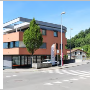
2017 Neubau von 2012