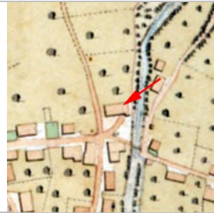
1827 - Negrelliplan Haus heute nicht mehr existent