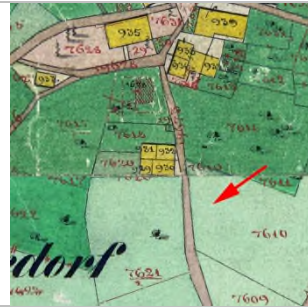
1857 Katasterplan (StAD)