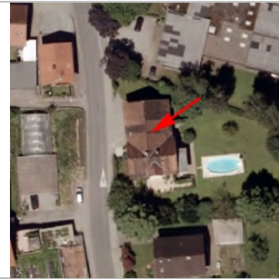
2015 Luftbild