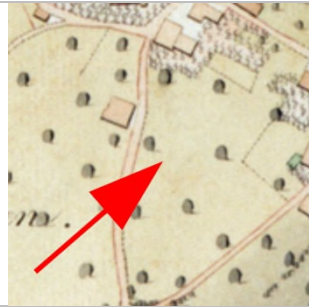
1827 Negrelliplan (StAD)

Dornbirn Weißachergasse 7 Um 1857: GSt. 7610 Um 2016: Bp. 1728