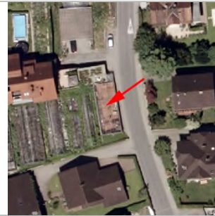
2015 Luftbild