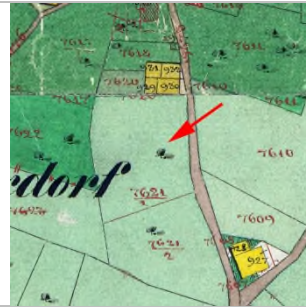
1857 Katasterplan (StAD)