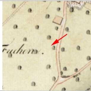
1827 Negrelliplan (StAD)

Dornbirn Weißachergasse 8 Bp. vor 1897: 929 Bp. um 2015: keine