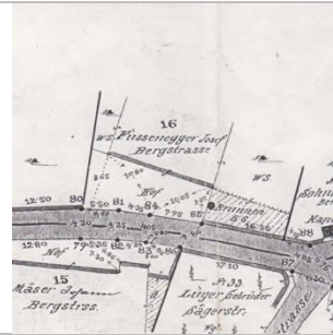
Wasserplan 1885