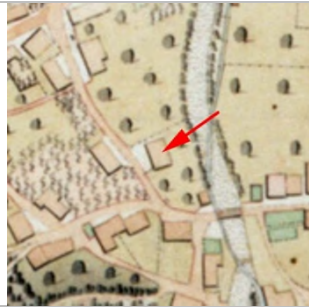
1827 - Negrelliplan