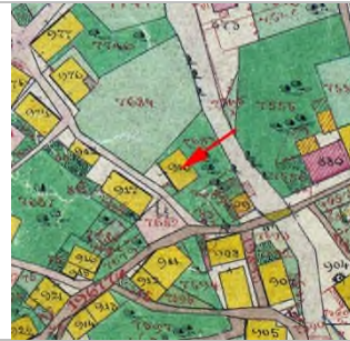
1857 - Katasterplan