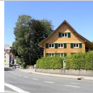
2016 - Parkplatz