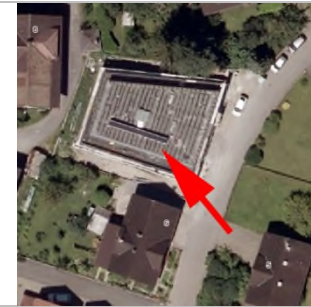
2015 Luftbild