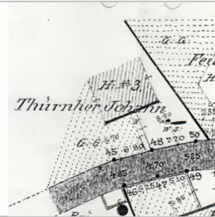
1907 (StAD: Wasserpläne)