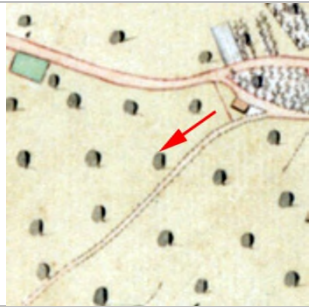
1827 Negrelliplan (StAD)