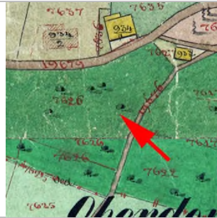
1857 Katasterplan (StAD)