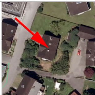
2015 Luftbild