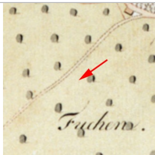
1827 Negrelliplan (StAD)