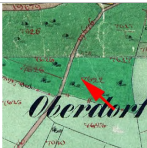
1857 Katasterplan (StAD)