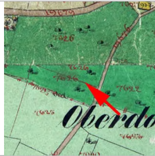
1857 Katasterplan (StAD)