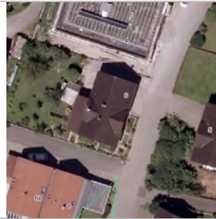
2015 Luftbild