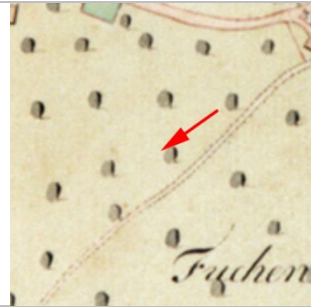
1827 Negrelliplan (StAD)