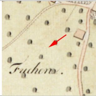
1827 Negrelliplan (StAD)