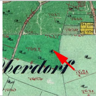
1857 Katasterplan (StAD)