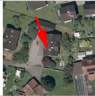
2015 Luftbild