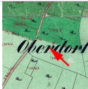
1857 Katasterplan (StAD)