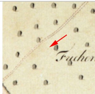
1827 Negrelliplan (StAD)