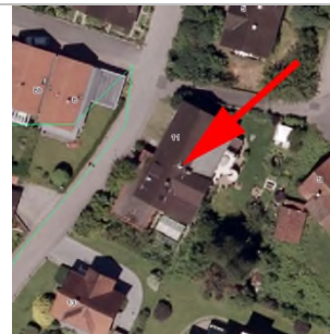
2015 Luftbild