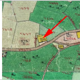
1857 Katasterplan (StAD)