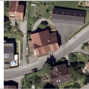
2015 Luftbild