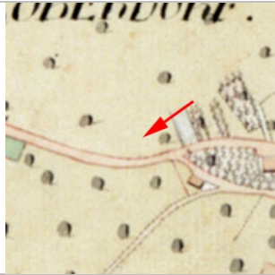
1827 Negrelliplan (StAD)

Dornbirn Sebastianstraße 7 Grundst.-Nr. 934