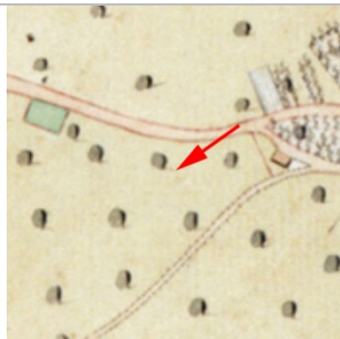
1827 Negrelliplan (StAD)