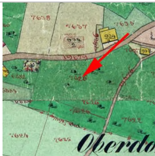
1857 Katasterplan (StAD)