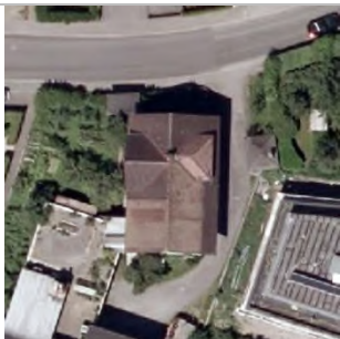
2015 Luftbild