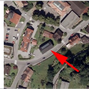
2015 Luftbild