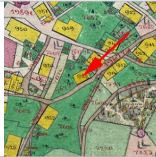
1857 Katasterplan