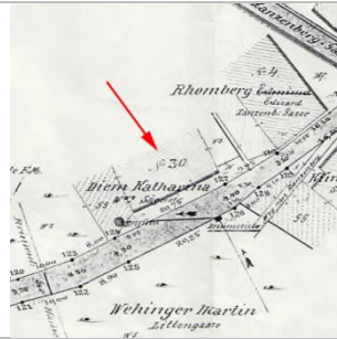
1890 (StAD: Wasserpläne)