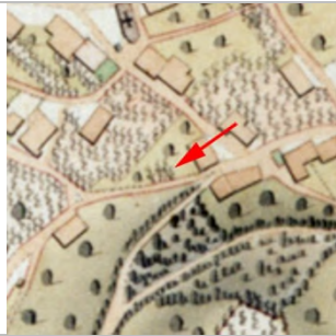
1827 Negrelliplan

Dornbirn Sebastianstraße 15 Grundst.-Nr. 922