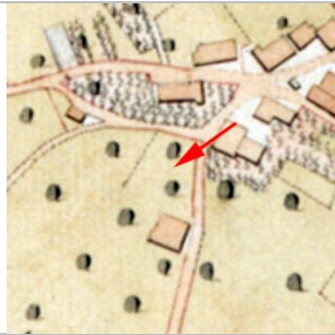
1827 Negrelliplan (StAD)