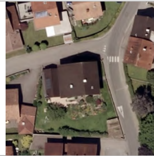
2015 Luftbild