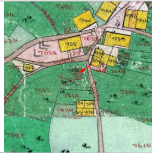
1857 Katasterplan (StAD)